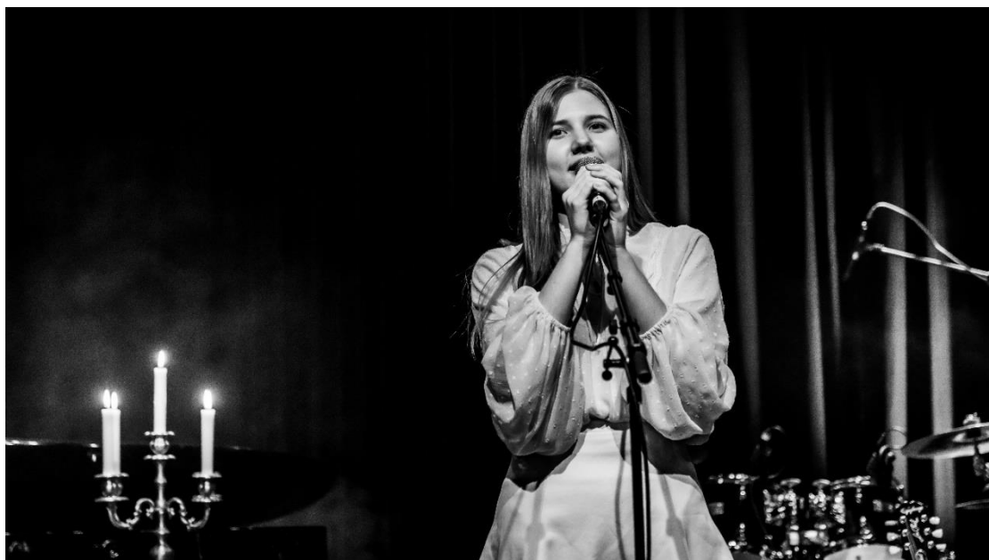
Spillerom-konsert på Karmøy Kulturskole, våren 2022

Å synge er sunt for både kropp og sjel. Forskning har påvist at sang forbedrer livet samt livskvaliteten til den enkelte. Sang fremmer livsglede, oppstemthet og en positivitet som kan smitte over på andre aktiviteter. I Karmøy Kulturskole får elevene innføring i sangteknikk, sjanger og repertoarkunnskap, musikk og konsertformidling. Elever kan starte på individuell undervisning i sang fra 7. klasse. Gruppeundervisning i sang er for elever fra 2. til 6. klasse, og er mer lekpreget og tilrettelagt for modenhet og alder. Alle elever vil få mulighet til å delta på konserter og fellesprosjekter gjennom skoleåret.