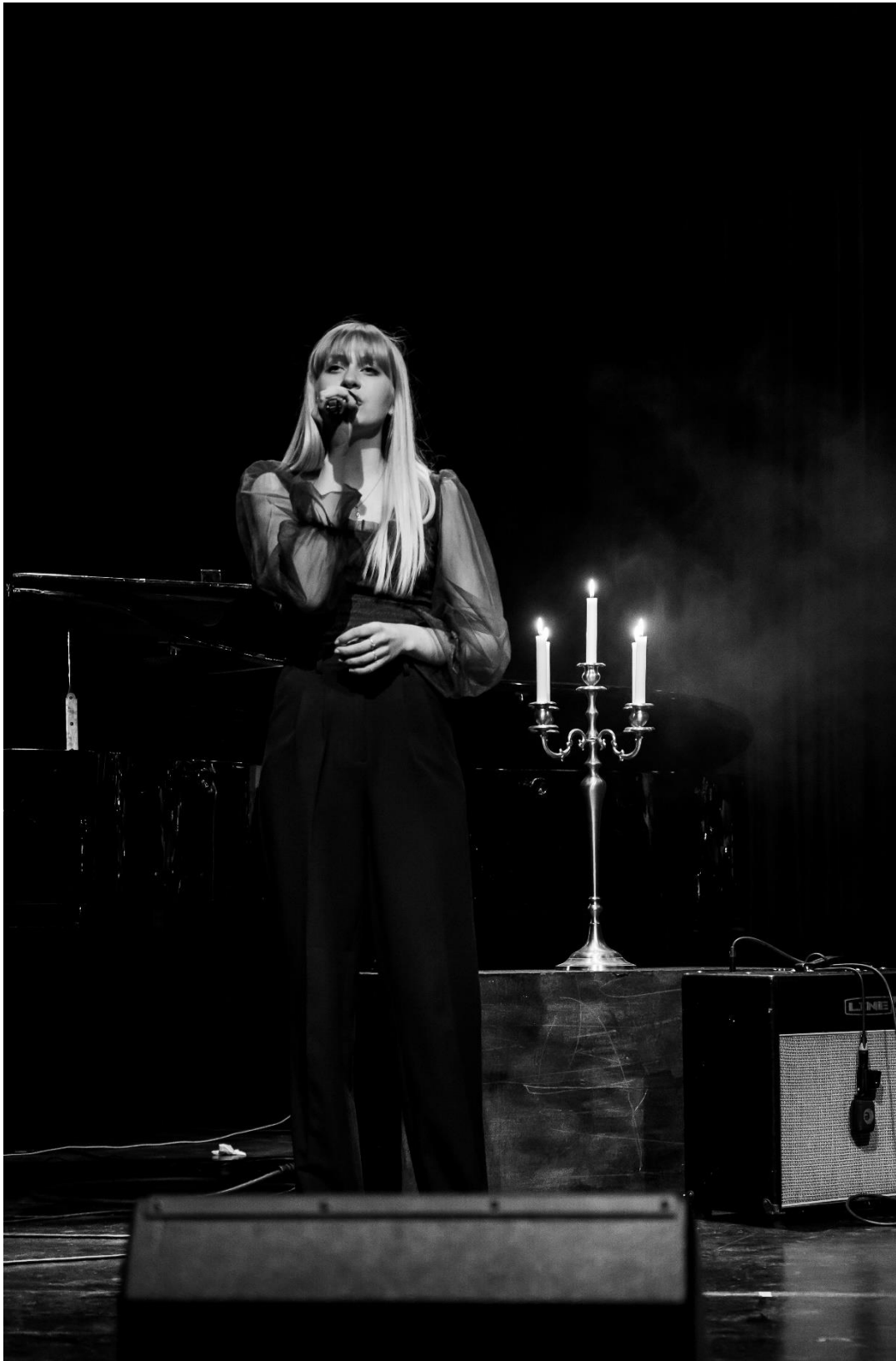
Spillerom-konsert på Karmøy Kulturskole, våren 2022