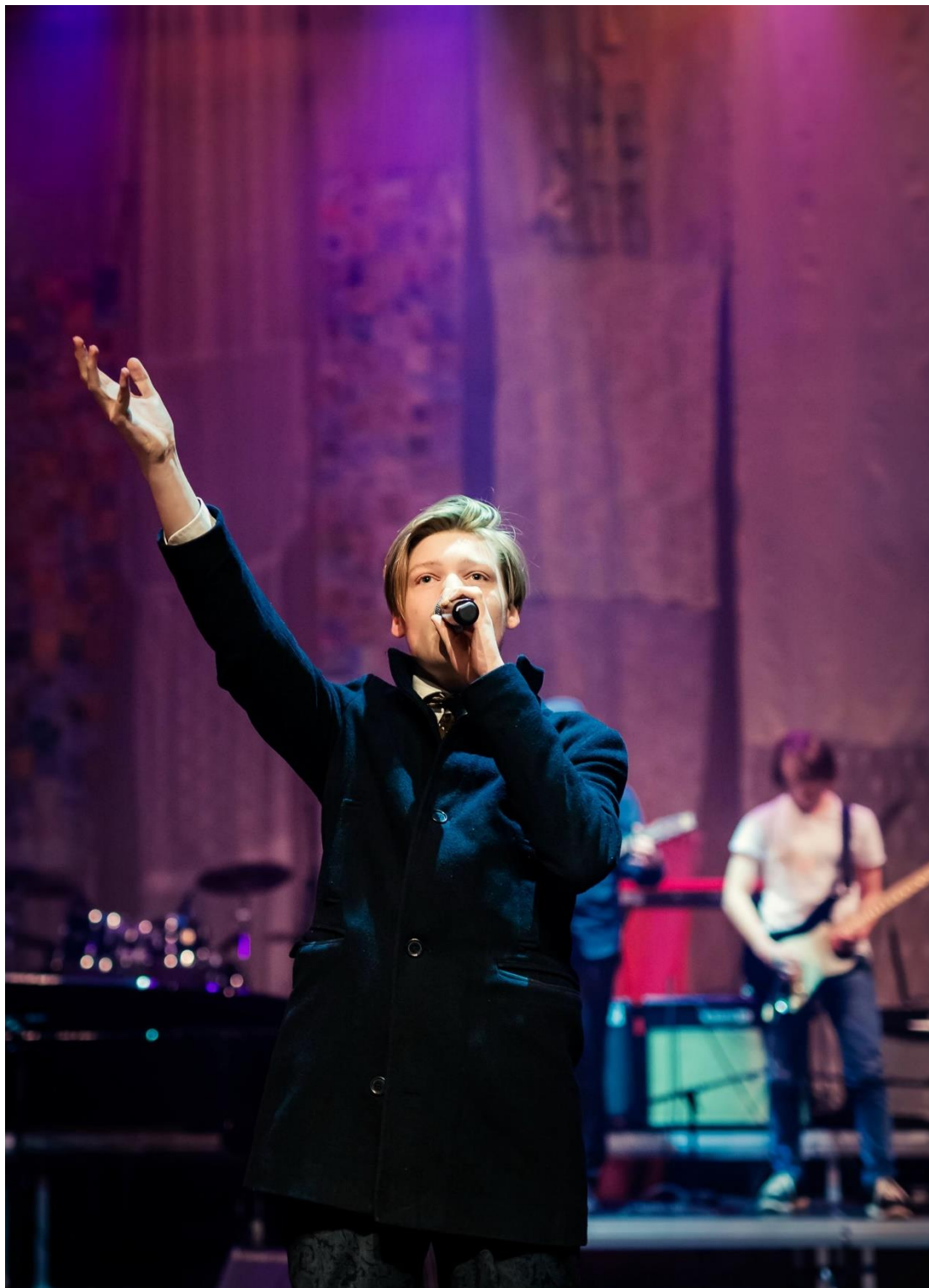
Fra jubileumsforestillingen «Lykken er» i Karmøy Kulturskole, 2018