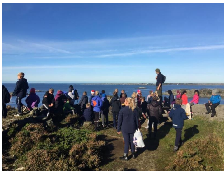
Gode fellesopplevingar kan byggja venskap og førebyggja krenking.

Mobbing er at ein eller fleire elevar seier eller gjer vonde og ubehagelege ting mot ein annan elev. Ved mobbing skjer dette fleire gonger, og den som vert utsett, har vanskeleg for å forsvare seg.